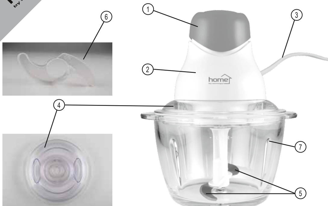
figure 1. • 1. ábra • 1. obraz • figura 1. • 1. skica • 1. skica • 1. obrázek • 1. slika